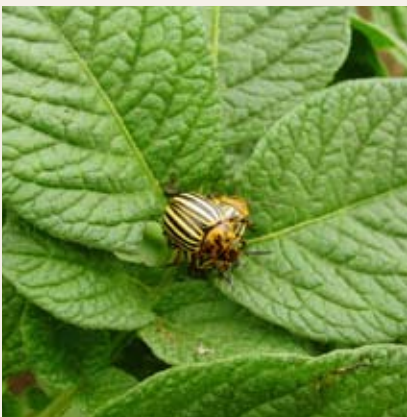
Obr. č. 10: Významný škůdce mandelinka bramborová Leptinotarsa decemlineata , proti kterému je třeba pravidelně chránit porosty brambor použitím insekticidů

Členovci, vyskytující se na pozemku, nejsou pouze škůdci, ale zastoupeni jsou také přirození regulátoři, kteří pomáhají snižovat početnost škůdců (např. sluněčka a larvy zlatooček, které se živí mšicemi) a hmyz, který neškodí ani není užitečný, ale je přirozenou součástí agroekosystémů. Údaj o riziku pesticidů pro necílové členovce má hlavní význam v integrované a biologické ochraně rostlin. Zvlášť významné postavení ve striktně definovaných systémech integrované