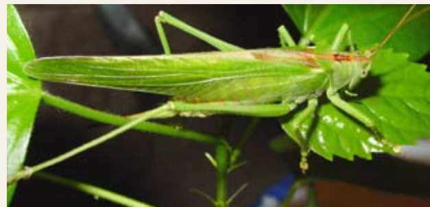
Obr. č. 12: Kobylka zelená Tettigonia viridissima je býložravec a saprofág, ale je rovněž významný přirozený regulátor živočišných škůdců – živí se hmyzem

Při testování rizika pro necílové členovce je zkoumán pouze omezený počet čeledí, které jsou standardně považovány za nejcitlivější modelové druhy. Z toho vyplývá, že pokud je přípravek označen jako nebezpečný pro jednu čeleď, může být potenciálně nebezpečný i pro jinou, netestovanou čeleď.