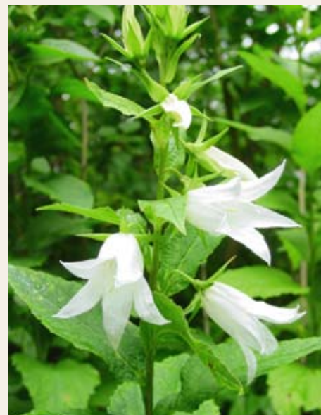
Obr. č. 13: Použití přípravků může představovat riziko i pro necílové rostliny – zvonek širokolistý Campanula latifolia