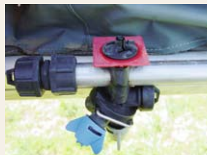
Obr. č. 14: Nízkoúletové trysky

Minimalizaci nežádoucích úletů při aplikaci přípravků lze ovlivnit vybavením aplikačních zařízení speciálními technickými opatřeními a použitím zejména protiúletových trysek. SRS připravuje systém protiúletových opatření a přehled klasifikovaných zařízení redukujících nežádoucí úlet.