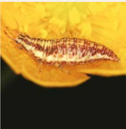
Obr. č. 11: Pokud používáme selektivní přípravky a dodržíme zásady správné aplikace, uchráníme např. i užitečné členovce – larva zlatoočky obecné Chrysoperla carnea – významný predátor mšic

produkce ovoce a révy vinné má dravý roztok Typhlodromus pyri , introdukovaný na ochranu proti škodlivým roztokům a stěžejní je rovněž znalost toxicity přípravků vůči používaným kmenům dravého roztoka T. pyri Chelčice a Mikulov v trvalých kulturách ovocných sadů a vinic. Na etiketě přípravku může být uvedeno označení Nebezpečný/zvlášť nebezpečný pro necílové členovce čeledi XX a s tím spojená ochranná vzdálenost (věta SPe 3), která by měla být při aplikaci dodržena, aby nebyla driftem zasažena okolní společenstva necílových členovců.