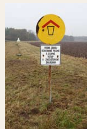
Obr. č. 5: Ochranné pásmo I. stupně, které je obklopeno ochranným pásmem II. stupně

U všech registrovaných přípravků v kategorii „nezařazeno“ SRS doporučuje uživatelům přípravků, aby při jejich použití postupovali s ohledem na princip předběžné opatrnosti tak, jako by se jednalo o přípravky, které jsou z použití v ochranném pásmu II. stupně zdrojů podzemní a/nebo povrchové vody vyloučeny.