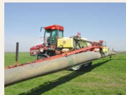
Obr. č. 15: Moderní aplikační zařízení jsou vybavena speciálními protiúletovými opatřeními

Další návody, jak dodržet jednotlivá omezení použití přípravků, lze nalézt na webu SRS http://www.srs.cz/portal/page/portal/SRS_Internet_CS/or